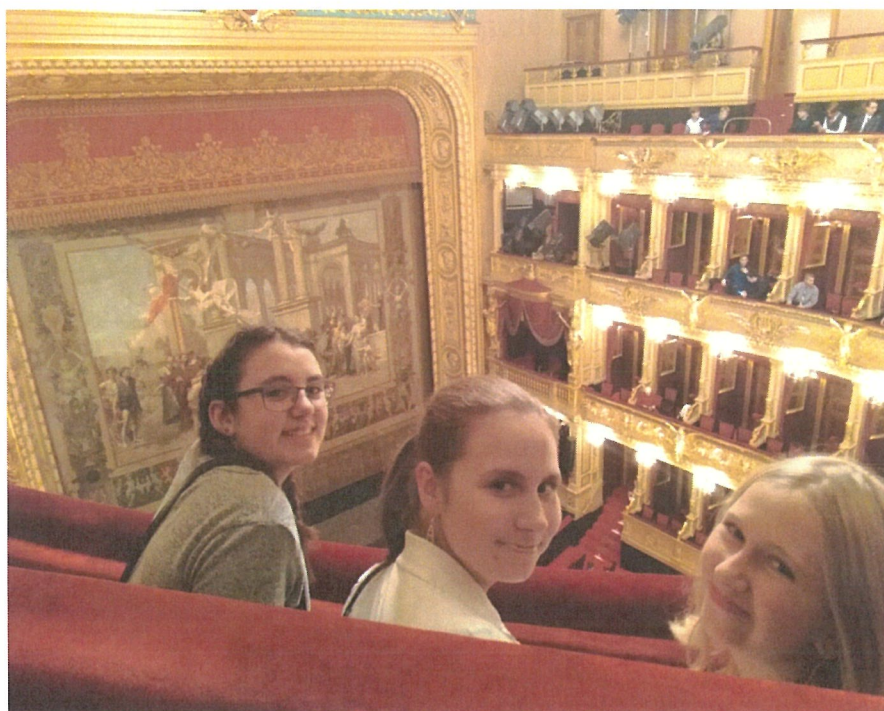
KMD – NÁRODNÍ DIVADLO