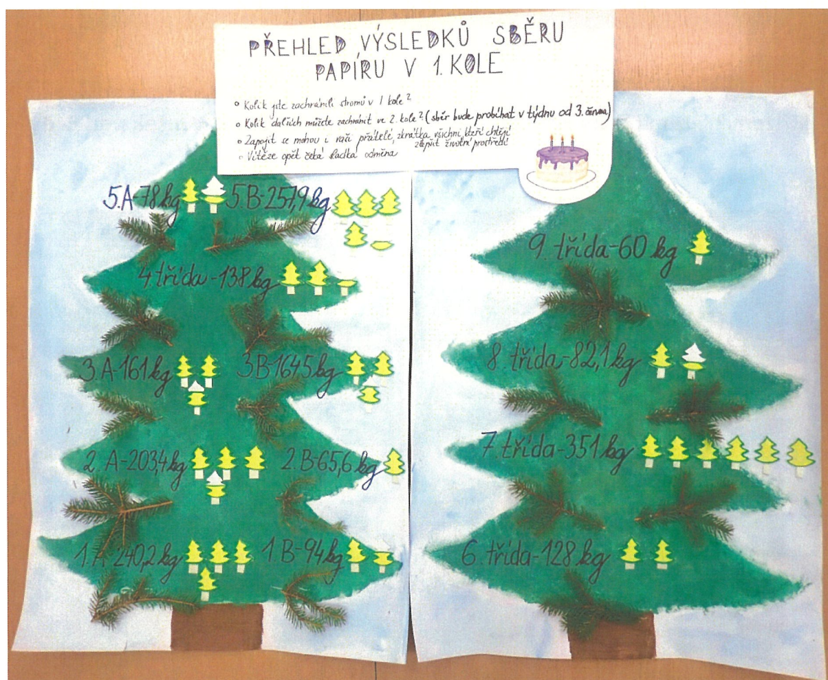
Výsledky sběru druhotných surovin - papíru