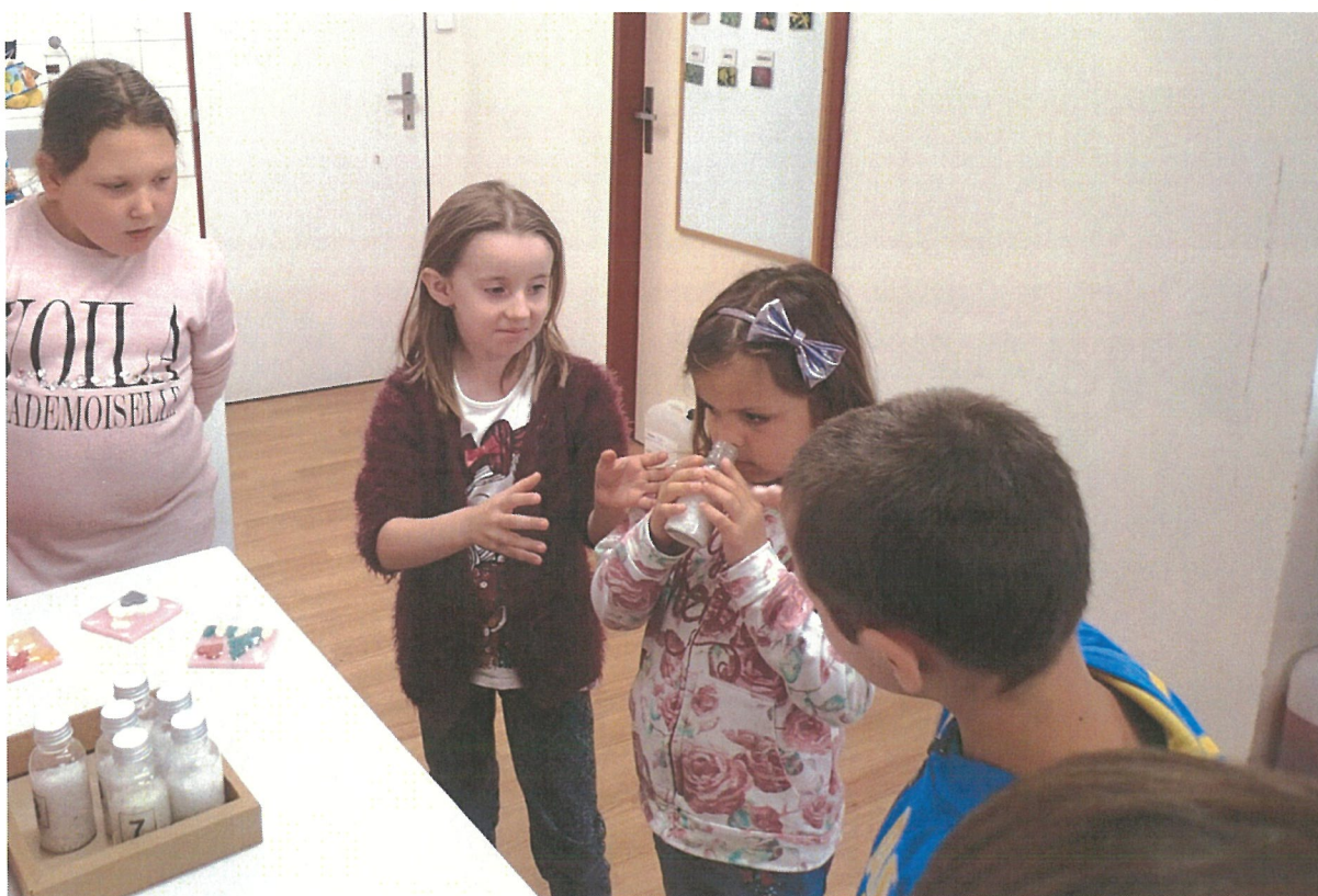
Exkurze v mýdlárně BOEMIE

Byla podána anonymní stížnost na ČŠI, která byla řádně prošetřena a projednána se všemi zúčastněnými.