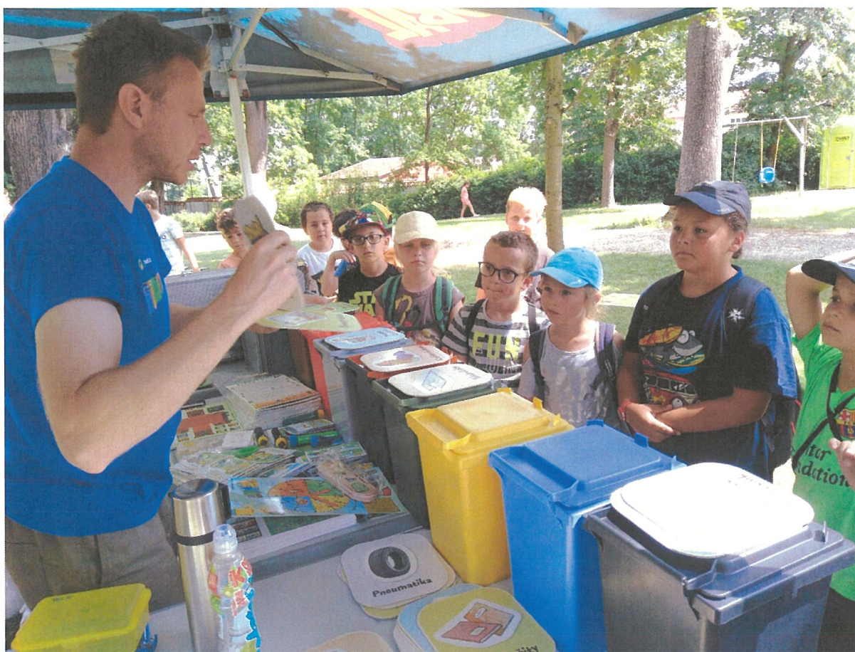
Program EVVO - recyklace

Škola se do rozvojových a mezinárodních programů zatím nezapojila, ale budeme intenzivně pracovat na tom, aby v příštích letech tomu tak nebylo. Jsme připravení se aktivně do těchto programů zapojit.