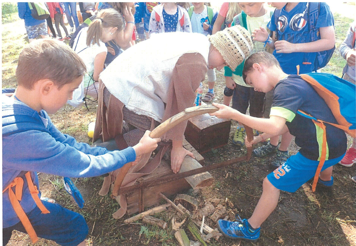
Mezinárodní den dětí - podhradí patří dětem – hrad Karlštejn