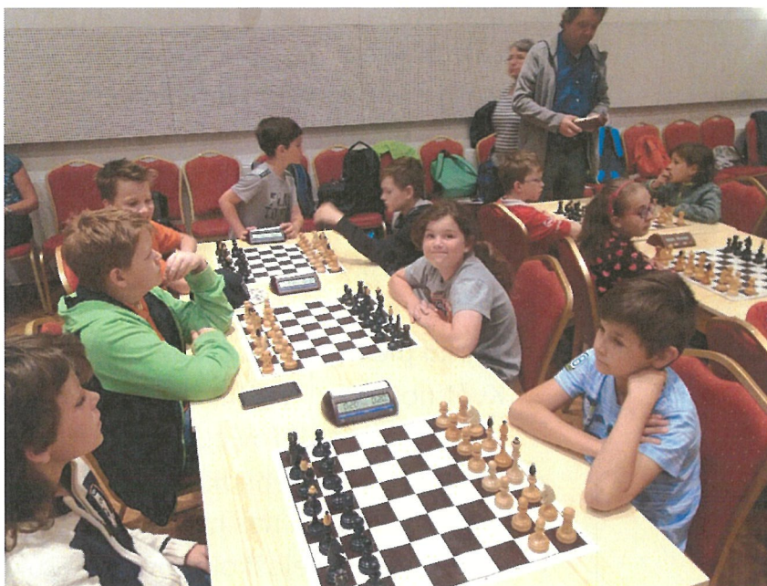
Šachový kroužek slaví veliké úspěchy v krajském přeboru