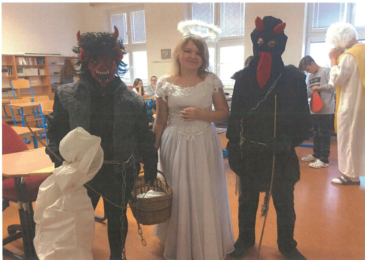
Naši „Andílci“ : -)))

V srpnu 2019 jsme podali žádost na podporu "Zkvalitnění výuky na ZŠ v Litni“, včetně vyhotovení jejich příslušných příloh, v rámci výzvy č. 02_18_063 OP VVV. Tuto dotaci se nám podařilo vyzískat a s částkou 1 214 291,-. Finanční prostředky jsme především využili na zkvalitnění výuky pomocí ICT techniky a vybavení školy. Další finanční prostředky jsme použili na činnost školní psycholožky, otevření klubu pro žáky a podporu žáků ohrožených školním neúspěchem.