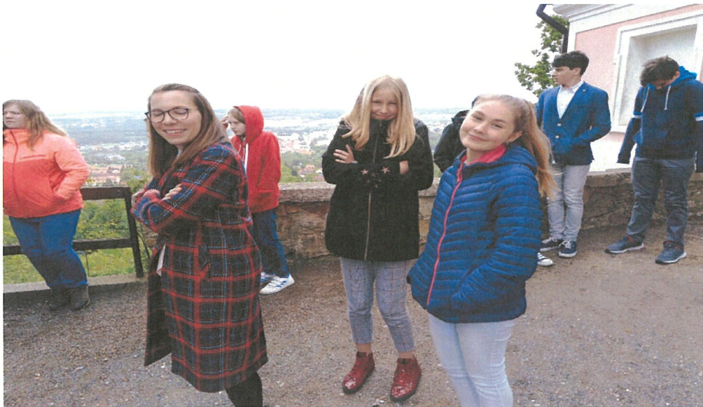
„Křížem krázem naším krajem“ – prezentační přehlídka – Mníšek pod Brdy