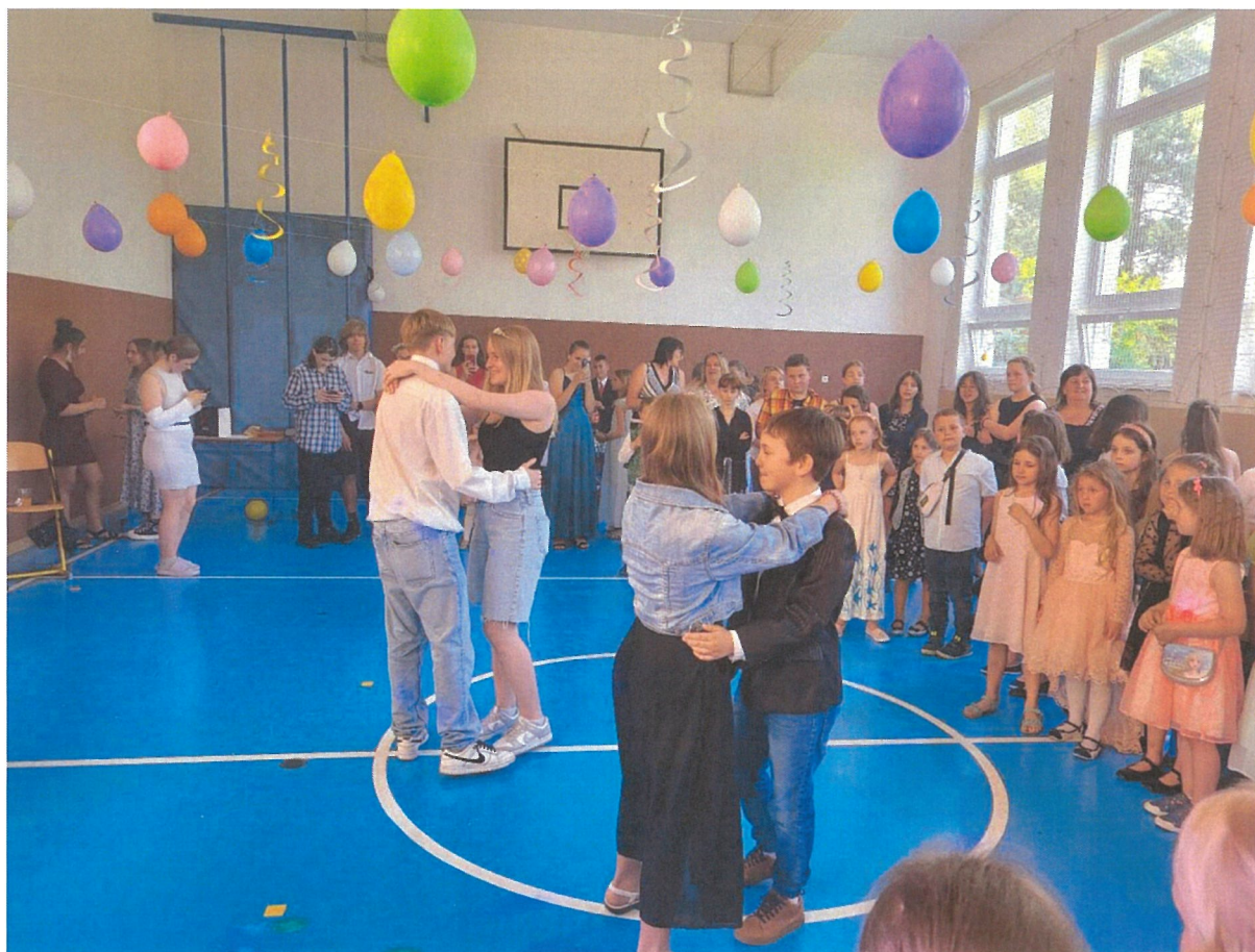
Školní májový ples

Program celoživotního vzdělávání na pedagogické fakultě Univerzity Karlovy v Praze - obor - Pedagogická činnost na II. stupni a střední škole se závěrečnou zkouškou a certifikátem navštěvuje jeden pedagog.