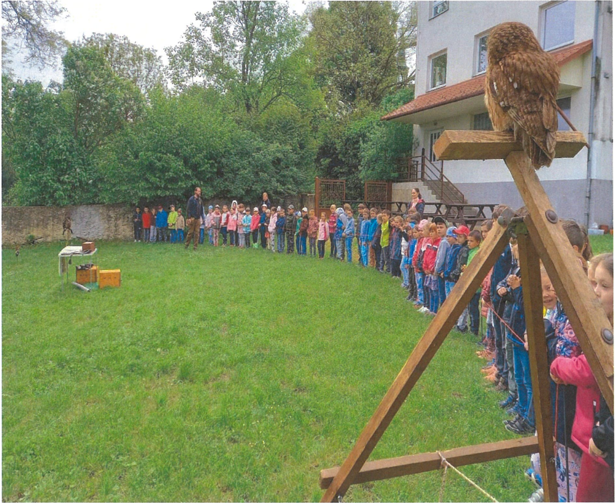
Dravci a sovy