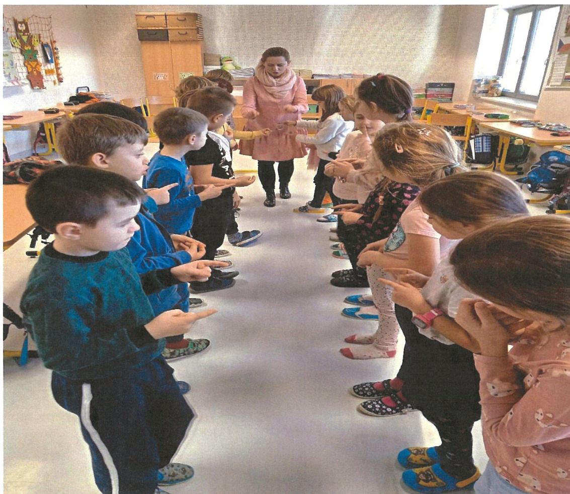
Preventivní program – stmelování kolektivu

Oblasti DofE jsou pohyb, dovednost a dobrovolnictví. U každé aktivity se stanoví určitý cíl, který bude motivovat a posouvat žáky dál. Na závěr absolvují týmovou expedici v přírodě. Celou svou cestu programem zaznamenávají do online aplikace, a když je potřeba, mají k dispozici vedoucího, který poradí.