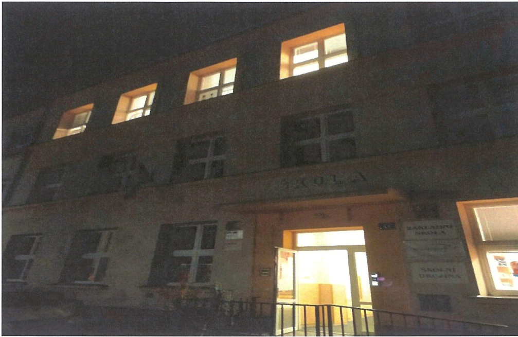
Noc s Andersenem