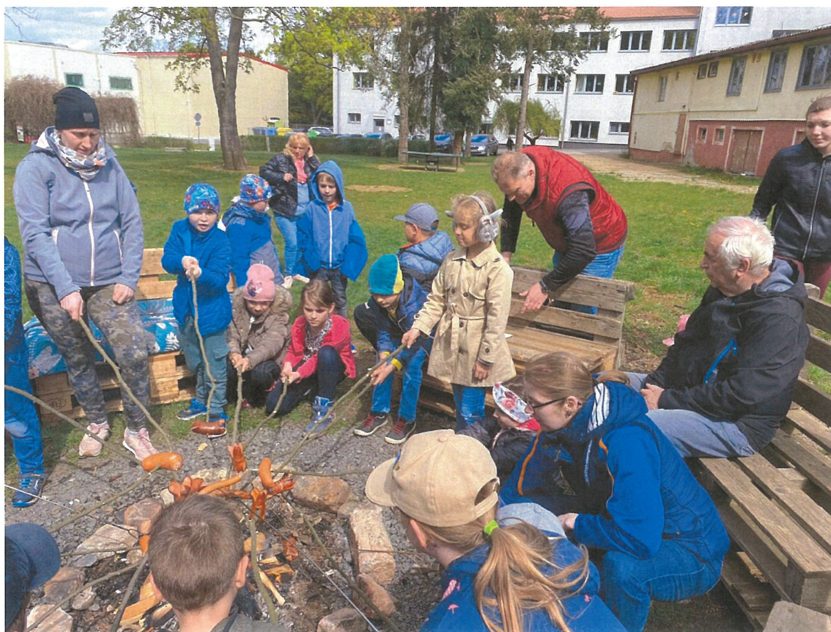
Opékání buřtíků ve školní družině